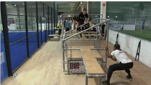
Saut, course, glissade... Tout est permis pour toucher ou fuir son adversaire.

Si le chat touche la souris, il devient alors souris lors de la manche suivante. Si la souris ne se fait pas toucher au bout du temps imparti, elle rapporte un point à son équipe. Généralement, s'il y a 0-0 au bout des 16 manches, alors intervient la mort subite. Celui qui se fait toucher le moins rapidement remporte la partie.