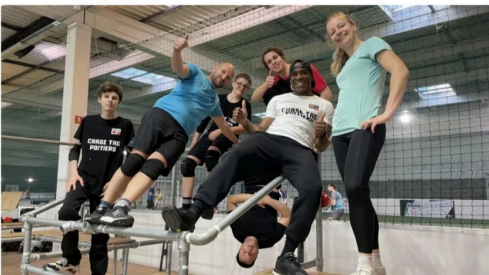
Certains membres de l'association Chase Tag Poitiers vont participer à une compétition à Roubaix, qui aura lieu à la fin du mois de juin prochain.