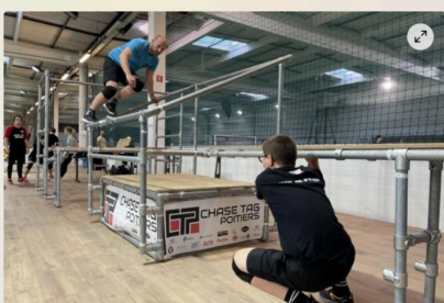
Au chase tag, le chat, appelé "chaser", doit toucher son adversaire, un "evader", en moins de 20 secondes pour éviter qu'il marque un point.

Écrit par Paul Grelier Publié le 04/05/2024 à 06h30